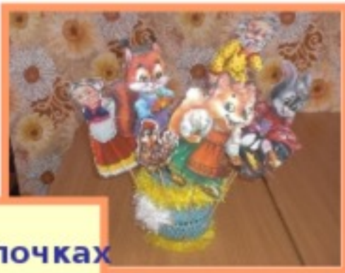
Театр на палочках