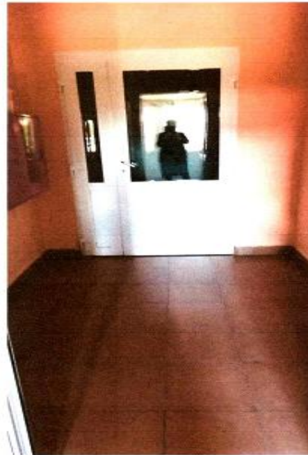
6 Тамбур Центрального входа №1