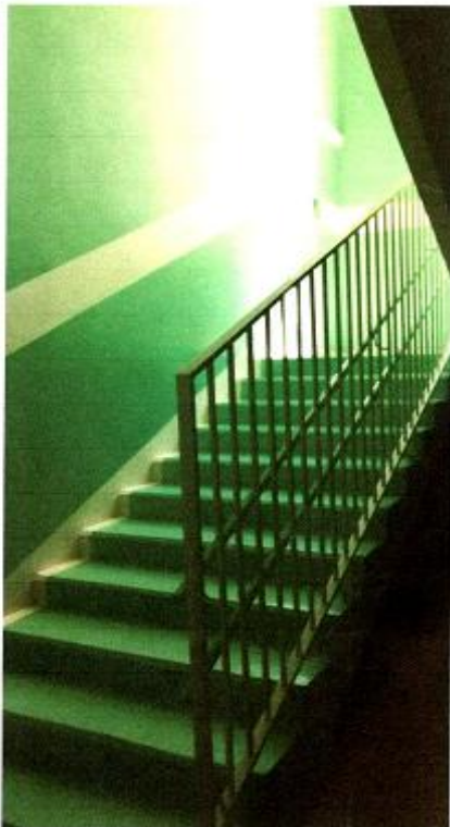
9 Пути эвакуации 2 этаж