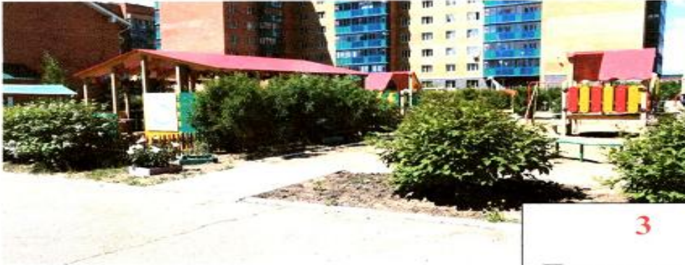
3 Путь движения на территории