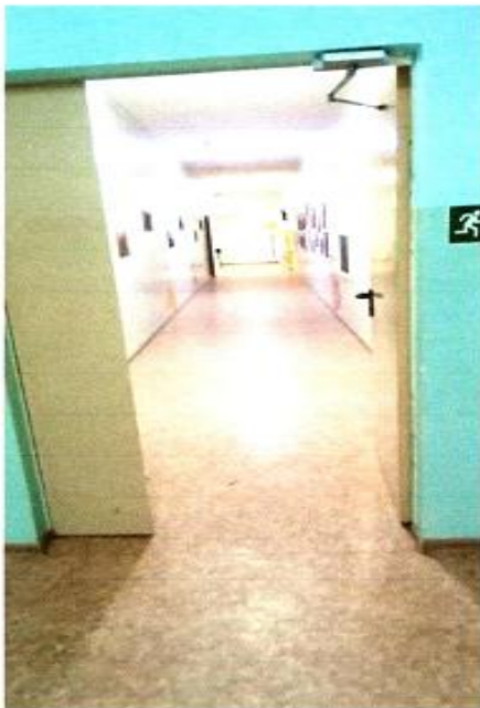
7 Коридор 1 этаж