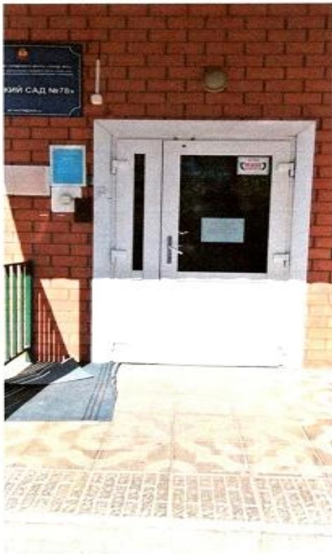
4 Центральный вход №1