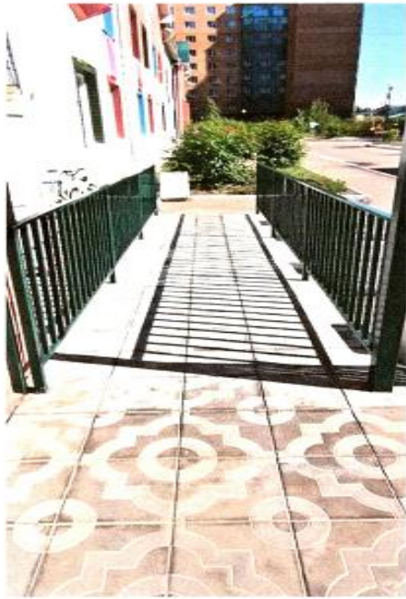
5 Пандус при входе №1