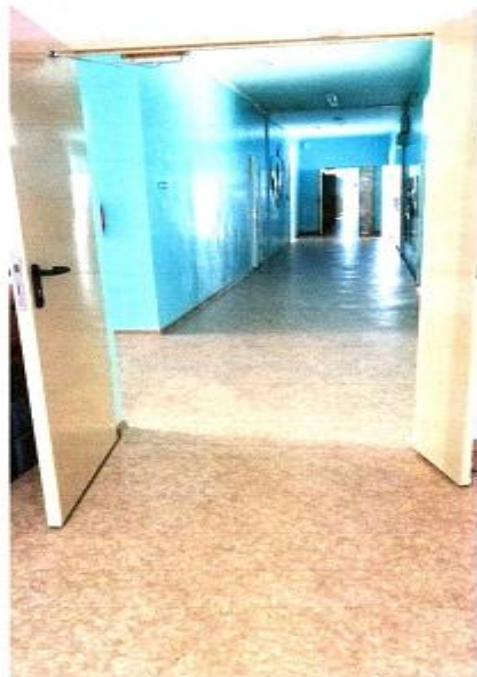
8 Коридор 2 этаж