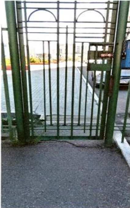
1 Вход в центральную калитку