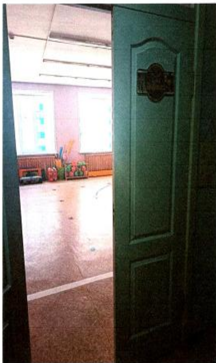
13 Спортивный зал