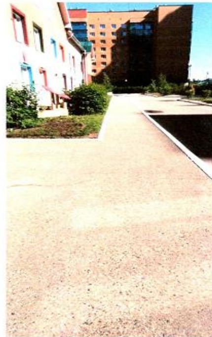
2 Путь движения на территории